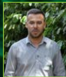
Por Fabricio de Oliveira, RTV Coopercam

Em seguida, essas folhas devem ser armazenadas em sacos de papel e identificadas conforme os talhões coletados. Nunca em sacos plásticos, pois as folhas “suam” e apodrecem, e isso interfere nos resultados. Se as folhas tiverem muita poeira ou resíduos, limpe-as com um pano seco ou papel toalha. Não lave com água corrente, pois isso remove nutrientes móveis, como o potássio (K). E, em seguida, essa amostra deve ser levada até o ponto de coleta mais próximo (lojas Coopercam). Caso haja necessidade de guardá-las de um dia para o outro, deve-se deixar o saco de papel aberto e dentro da geladeira por no máximo 24 horas.