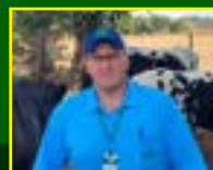
Por Ivan Luis de Moraes Ribeiro, Médico Veterinário Coopercam

A bovinocultura brasileira é composta, em sua maioria, por sistemas de produção a pasto, os quais dependem diretamente da qualidade e disponibilidade das forragens. Durante o período das águas, ocorre expressiva melhoria na oferta de pastagem, tanto em quantidade quanto em valor nutritivo, devido ao aumento das chuvas e da temperatura. Esse cenário favorece o ganho de peso, o desenvolvimento dos animais e o desempenho reprodutivo do rebanho.