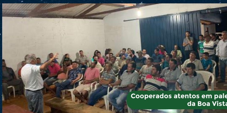
Cooperados atentos em palestra realizada na comunidade da Boa Vista dos Campos