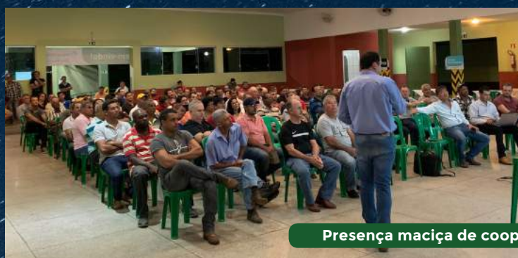
Presença maciça de cooperados em Campo do Meio